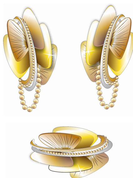
Рисунок 5. Гарнитур «Танец бабочек». Золото, литьё, ювелирная проволока в виде шариков, цепь «перлина», лазерный раскрой, лазерная