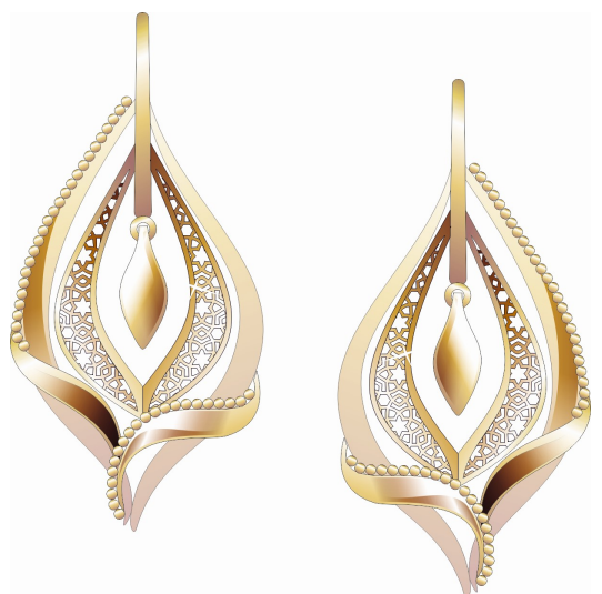
Рисунок 4. Серьги подвесные. Золото, декоративная ювелирная проволока в виде шариков, литьё, лазерная гравировка, лазерный