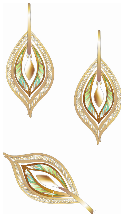
Рисунок 3. Гарнитур «Лист Ивы». Золото, витражная эмаль, литьё по выплавляемым моделям, лазерный раскрой, лазерная гравировка