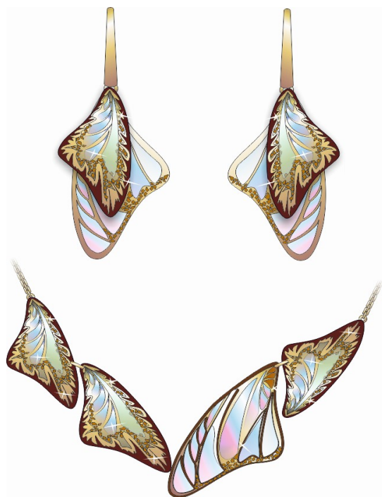
Рисунок 2. Гарнитур «Крыло бабочки». Золото, витражная эмаль, лазерная гравировка и резка

Третий период с 1910 по 1930 гг. – период спокойного течения стиля, уход от ярких цветов и насыщенности в образах, трансформация стиля в сторону геометрических, спокойных форм и лаконичности.